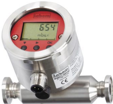
Druckmessumformer PASCAL CV

Crossflow Filtrationsanlage für die Pharma-Industrie